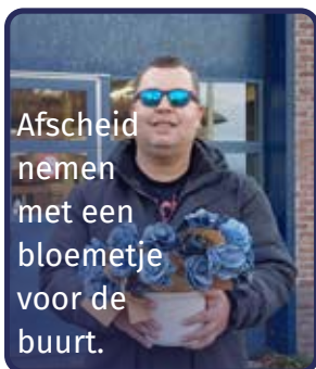
Afscheid nemen met een bloemetje voor de buurt.