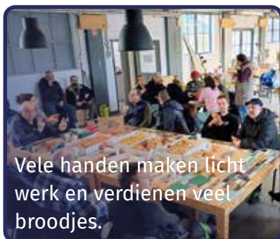
Vele handen maken licht werk en verdienen veel broodjes.