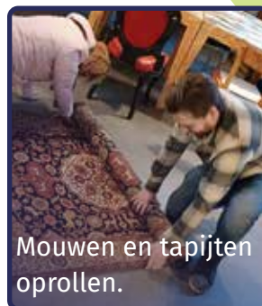
Mouwen en tapijten oprollen.