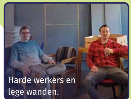
Harde werkers en lege wanden.